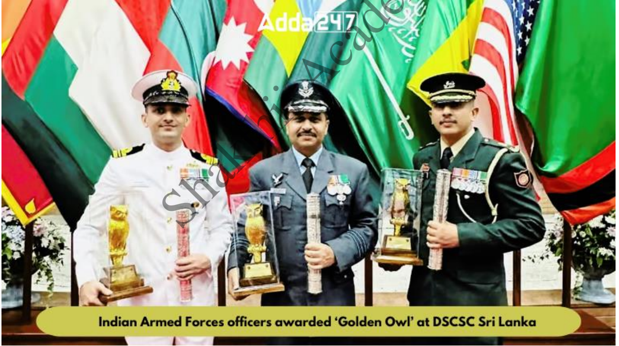
Indian Armed Forces officers awarded 'Golden Owl' at DSCSC Sri Lanka